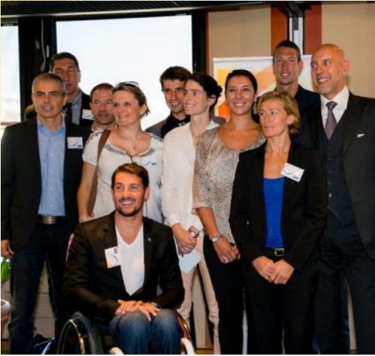
De grands sportifs Français présents pour soutenir le lancement de ce programme (24 sept 2013)